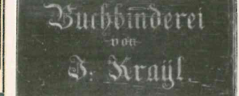
Anzeige Krayl, Gäubote 1905